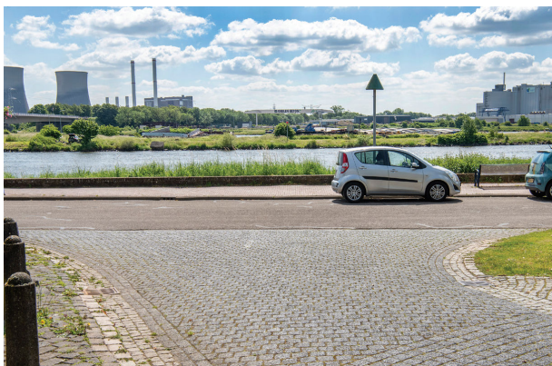
impresie vanaf de Maasstraat

Huidige situatie (2024) hoogte muur: +23.88