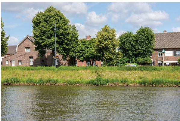
impresie vanaf het water

Situatie zichtjaar 2075 hoogte muur: +24.40