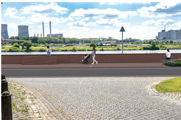
impresie vanaf de Maasstraat

Situatie zichtjaar 2125 hoogte muur: +24.60