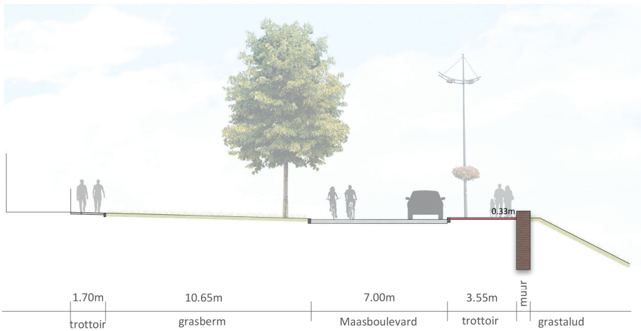
Doorsnede C: bestaande situatie hoogte muur: 33 cm