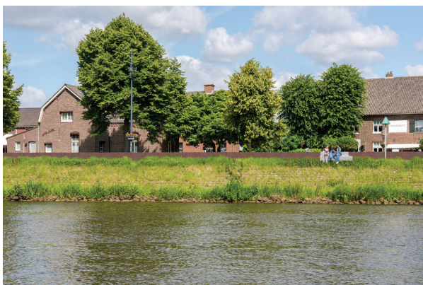
impresie vanaf het water