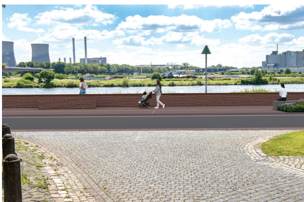
impresie vanaf de Maasstraat

Situatie zichtjaar 2075 hoogte muur: +24.40