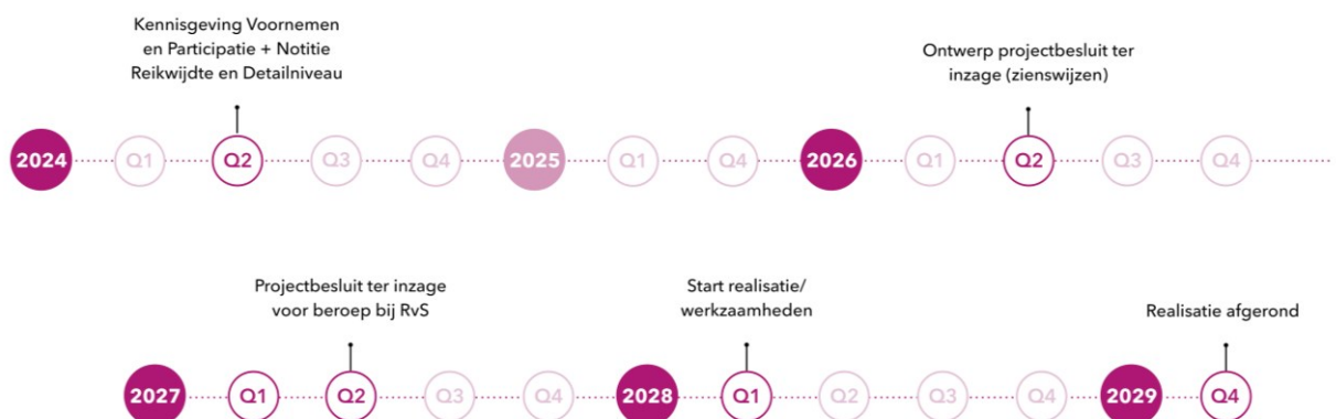
Figuur 5. Planning project Dijkversterking en -verlegging.

De planning van het project Dijkversterking en -verlegging is op hoofdlijnen in figuur 5 weergegeven.