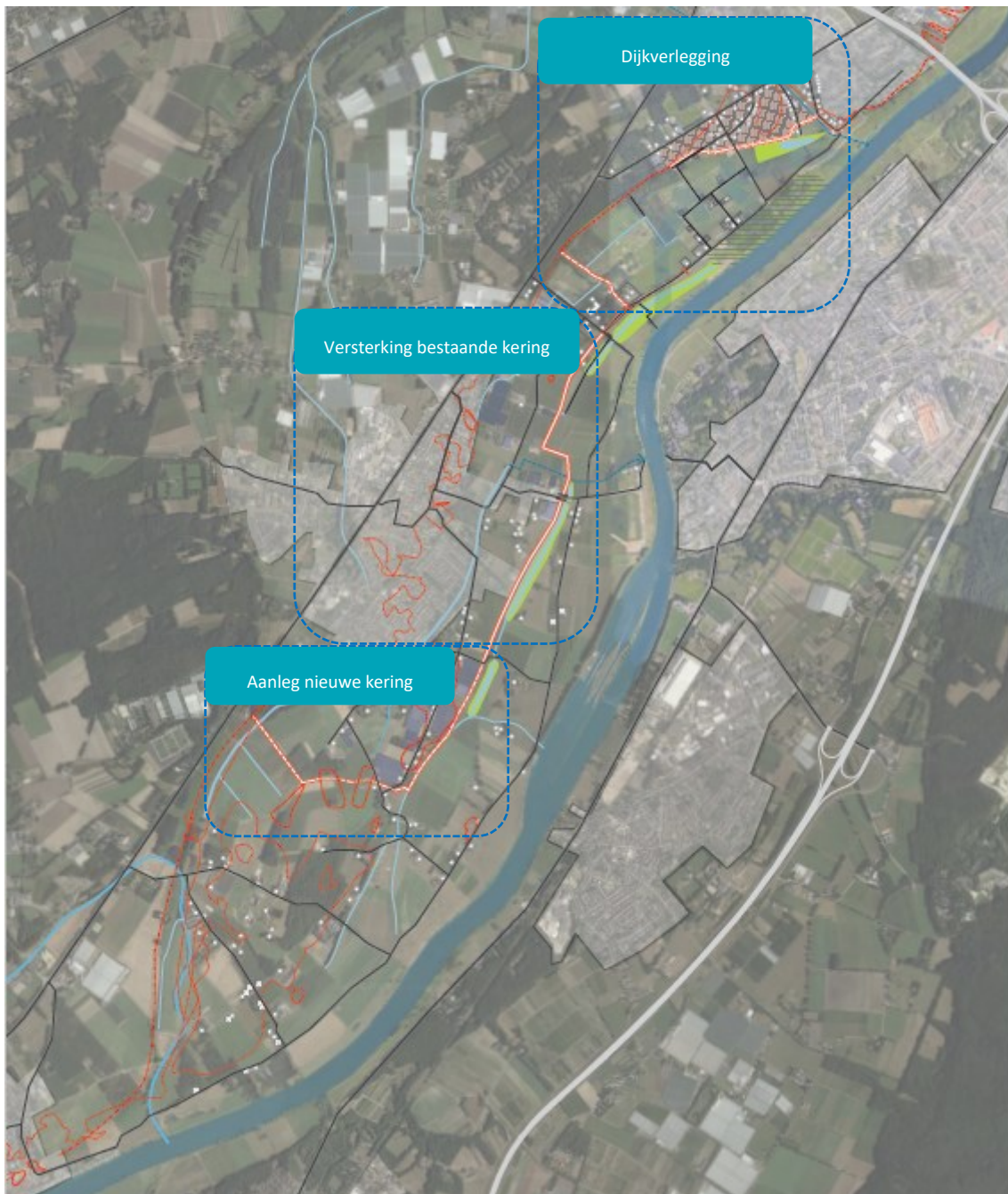
Figuur 1. Weergave van de verschillende deelgebieden in het project Dijkversterking en dijkverlegging