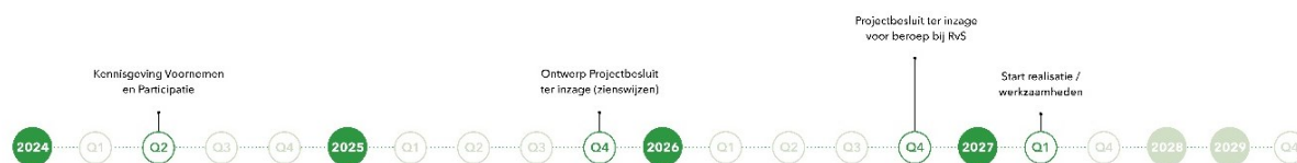
Figuur 4. Planning project Kwelgeulen.

De planning van project Kwelgeulen is op hoofdlijnen in figuur 4 weergegeven.