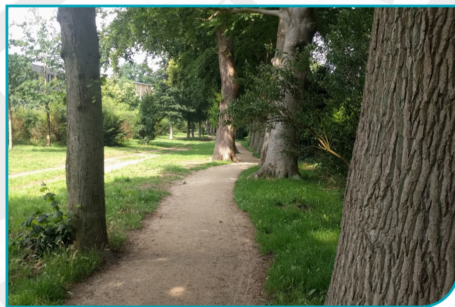
pad gebonden halfverharding